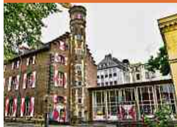
Das Kölnische Stadtmuseum